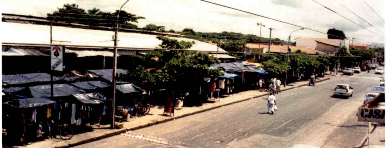
Parque Piaui: micro-produtores brigam pelo comercio local